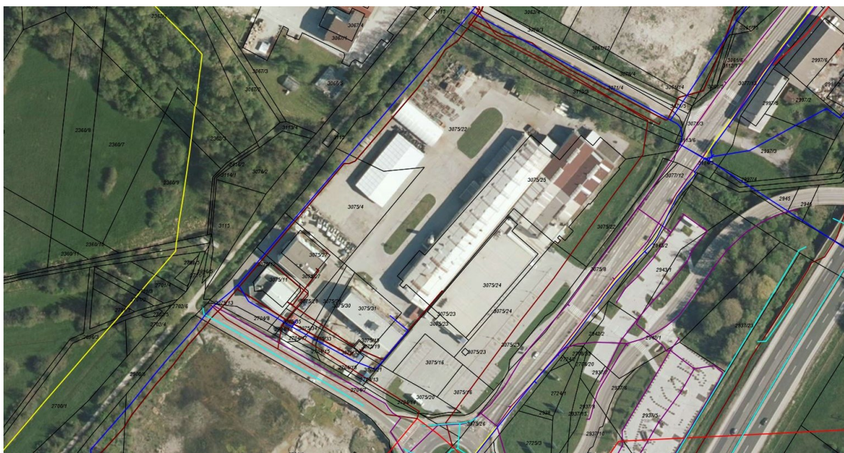
Slika 3: Gospodarska javna infrastruktura (rumena linija – plinovodno omrežje; temno rdeča linija – kanalizacijsko omrežje sanitarnih odpadnih voda; rdeča linija – elektroenergetsko omrežje; temno modra linija – vodovodno omrežje; svetlo modra linija – omrežje padavinskih odpadnih voda; temno vijola linija – javna razsvetljava; oranžna linija – TK omrežje; iObčina, januar 2022).