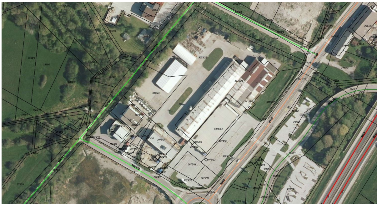
Slika 2: Javne ceste na območju SD OPPN in širše (javna pot 966656 – Cesta G; regionalna cesta 0300 – Brezovica – Vrhnika; iObčina, januar 2022).

Priključki na javno pot in regionalno cesto se s SD ne spreminjajo.